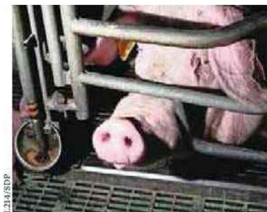
La cage en métal où les truies des élevages intensifs passent leur vie entière n'a rien à envier à l'instrument de torture médiéval appelé « la vierge de fer ».

pour l'environnement : l'élevage industriel est, à l'échelle mondiale, la deuxième source des émissions de gaz à effet de serre (15 %). Ensuite, cela contribue à accroître la pauvreté dans le monde. Est-il normal d'envoyer 800 millions de tonnes de grain d'Amérique latine vers les pays occidentaux pour satisfaire nos envies carnées, alors que cela pourrait nourrir 1 milliard de personnes ! Et enfin, consommer de la viande n'a rien d'indispensable... D'autant qu'elle peut être cancérigène, a établi l'Organisation mondiale de la santé.